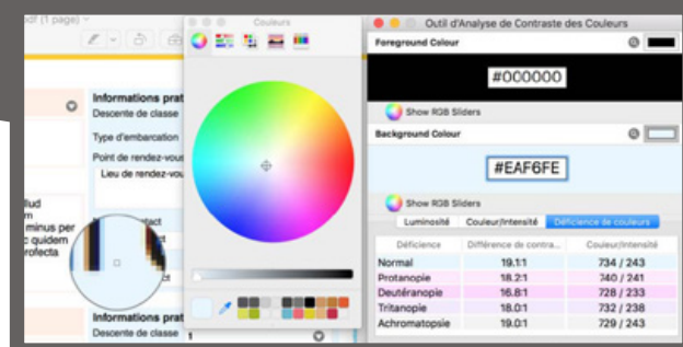
Légende : le logiciel «Color Contrast Analyser» permet de vérifier les contrastes entre la couleur du texte et la couleur du bloc de texte.

D'un point de vue pratique, il existe plusieurs dizaines d'outils web ou logiciels pour contrôler les contrastes. « Colour Contrast Analyser » permet par exemple d'identifier le ratio de contraste directement depuis le poste de travail. Ce logiciel libre est de plus disponible pour Mac et PC sous licence libre GPLv3.